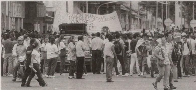
La marcha pacífica convocada por la Universidad Surcolombiana, inició ayer a las 10:00 a.m. desde el alma máter y culminó en la Plaza de Banderas de la Gobernación del Huila.

▶ Sin disturbio alguno, nuevamente los estudiantes universitarios, docentes y sindicalistas de Neiva marcharon en contra de la reforma de la Ley 30. Exigieron el respeto de la educación pública y la salud a nivel nacional.