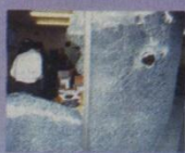
Imagen de uno de los destrozos.

afectada confirmaron que aunque los daños ocasionados fueron menores, contradice la esencia de una manifestación que se suponía pacífica. Las autoridades