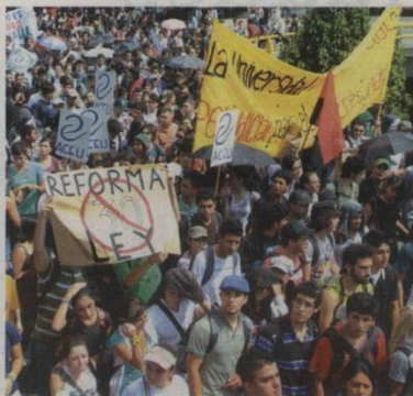
El intercambio vial Punto Cero fue el lugar de encuentro de los académicos. Literalmente no había espacio para un solo marchante más. De miles que marcharon, solo una decena optó por la violencia. Pablo Pizarro

Suficiente financiación, respeto por la autonomía universitaria, incremento de la participación de estudiantes y docentes