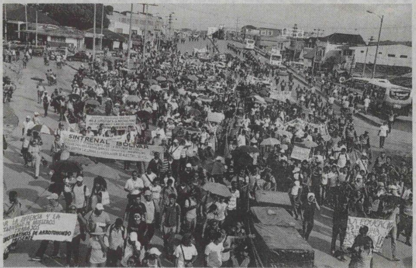
La manifestación generó caos vial por varias horas.

En Cartagena, la Policía Metropolitana hizo saber a los participantes estudiantes de las Universidades, SENA y miembros de la CUT, que no se entraría en choque y que se podrían expresar libre y pacíficamente, aclarando que la presencia del personal policial es solo para prestar un acompañamiento y evitar que factores externos influyan negativamente en estas