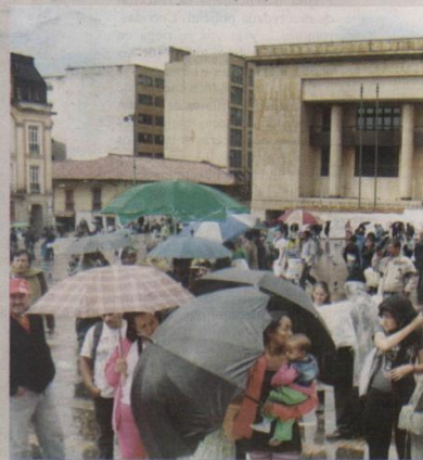
En la Plaza de Bolívar de Bogotá fue muy poca la asistencia a la pr

La propuesta de reforma fue presentada al país el pasado 10 de marzo por el Presidente de la República, Juan Manuel Santos. Posteriormente, fue analizada en una serie de foros sobre Educación Superior en los que participaron rectores, profesores y estudiantes en diferentes regiones del país.