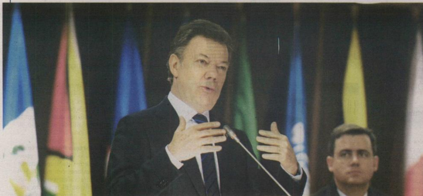
El presidente Juan Manuel Santos concibe la reforma a la Educación Superior como un derecho de todos los colombianos y no como un producto mercantil.

INSTAN AL CONGRESO PARA APROBAR LA INICIATIVA