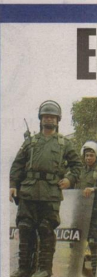
La Policía hizo presen