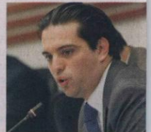
■ Simón Gaviria, presidente de la Cámara de Representantes

Este proyecto reglamenta temas como: requisitos para la creación de municipios; fun-