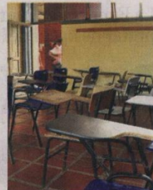
Las clases no se reanudaron ayer en la Uniatlántico.

La jornada terminó con la invitación de la Ministra para que los estudiantes lleven sus propuestas al Congreso de la República, así como enfatizó que los jóvenes que se encuentran en paro regresen lo más pronto posible a clases para así evitar la cancelación del semestre.