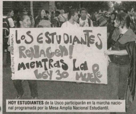
HOY ESTUDIANTES de la Usco participarán en la marcha nacional programada por la Mesa Ampla Nacional Estudiantil.

Hasta que no se realice Asamblea General, estudiantes de la Universidad Surcolombiana continuarán en paro. Así lo afirmó, Presidente del Consejo Superior Estudiantil.