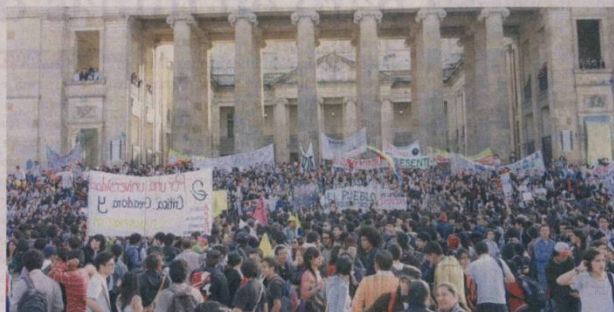
Pese al ofrecimiento de retirar el proyecto de reforma a la educación, los estudiantes tienen lista para hoy una movilización masiva en Bogotá.

»El presidente Juan Manuel Santos cedió en la máxima pretensión de los estudiantes en paro: retirar el proyecto de reforma a la ley 30. La única condición es que los estudiantes vuelvan a clases.