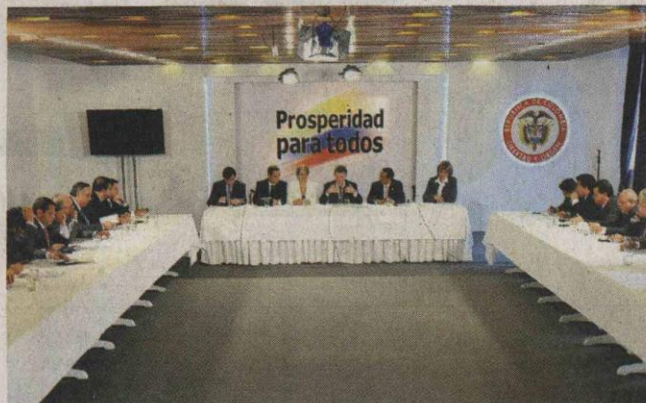
Santos discuti  ayer la reforma con un grupo de congresistas.

el paro sea levantado, los estudiantes universitarios mantienen la decisi n de llevar a cabo las marchas nacionales programadas para hoy.