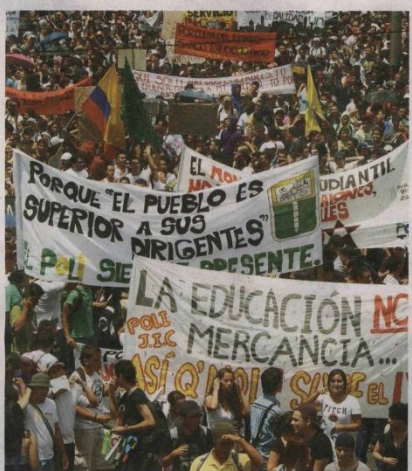
Aunque el presidente Santos dijo que la reforma a la educación superior se retirará del Congreso si los estudiantes levantan el paro, hoy se realizará la marcha nacional convocada por la Mesa Amplia Nacional Estudiantil.