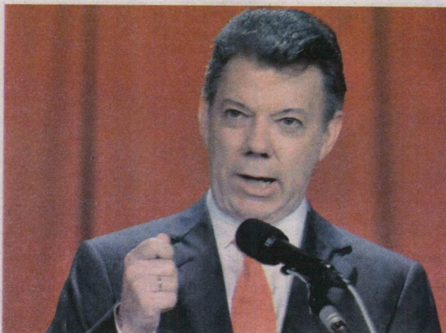
EL PRESIDENTE Juan Manuel Santos condicionó el retiro de la reforma educativa a que los estudiantes vuelvan a clases.