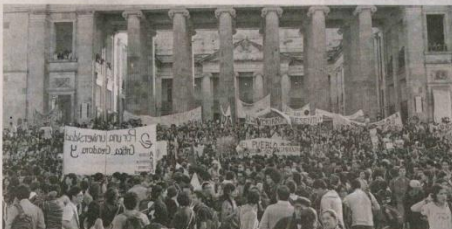
Pese al ofrecimiento de retirar el proyecto de reforma a la educación, los estudiantes tienen lista para hoy una movilización masiva en Bogotá.

«El presidente Juan Manuel Santos cedió en la máxima pretensión de los estudiantes en paro: retirar el proyecto de reforma a la ley 30. La única condición es que los estudiantes vuelvan a clases.»