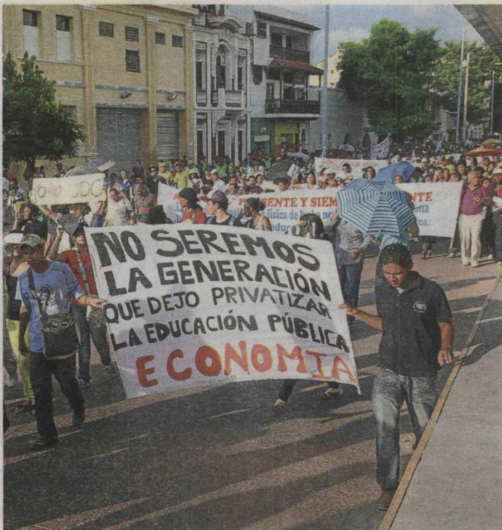
Ayer los estudiantes de Unicartagena manifestaron su inconformidad en las calles. YOMAIRA GRANDETT