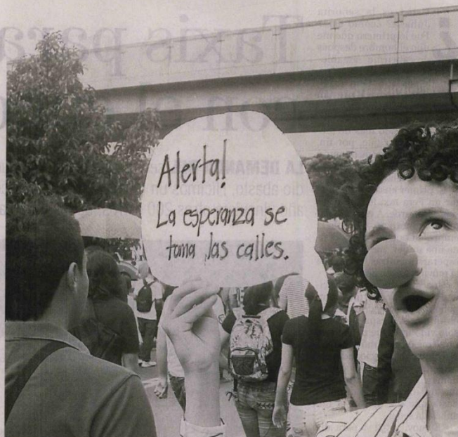
Los estudiantes pedían una educación de mayor calidad y gratis. También dejaron claro que para ellos el primer paso lo debe dar el Gobierno Nacional, retirar la reforma antes de que el paro termine.

Y es que mientras los estudiantes caminaban por las calles de las diferentes ciudades del país, el Presidente volvió a