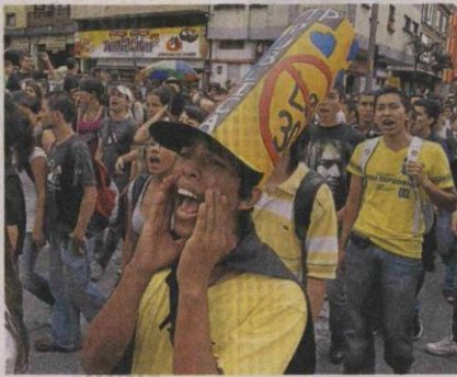
Estudiantes de la Universidad Tecnológica de Pereira, ayer. NIETO

Asimismo, señaló que "está abierta la invitación