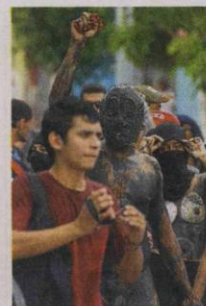
Así fue en Barranquilla.