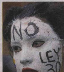
Marcha con arte. D. BUSTAMANTE

En esa afirmación coincidieron los universitarios consultados por este diario en medio de la marcha.