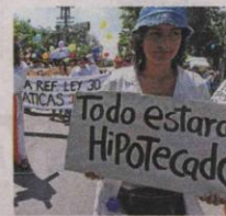
La marcha, ayer en Cali.

Padres de familia salieron a acompañar el clamor de los estudiantes. Las autoridades reportaron normalidad.