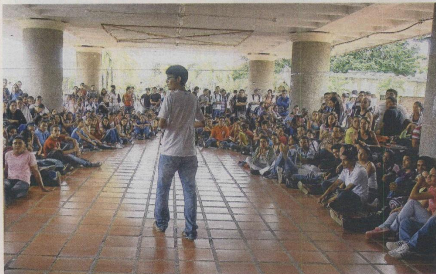
En la Universidad del Atlántico (Barranquilla), ayer, los estudiantes se preparaban para la jornada de protesta de hoy. OSCAR BERROCAL

Rechazó que las universidades públicas y privadas puedan entrar en liquidación y volverse mixtas. "Quebrarán a las públicas para volverlas mixtas y así tendrán que buscar financiación privada, y se perderá la lógica de la investigación y el conocimiento público, que sirve a todos y no solo a unos", dijo. Igual, rechazó que la matrícula en las privadas pueda subir por encima del Índice de Precios al Consumidor.