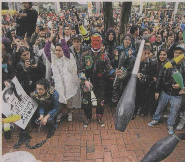
El jueves, 30.000 personas se manifestaron en Bogotá.

Los voceros de los estudiantes, que se enteraron de la decisión durante una reunión, estallaron en gritos y aplausos. Y aunque hoy en la tarde le responderán oficialmente