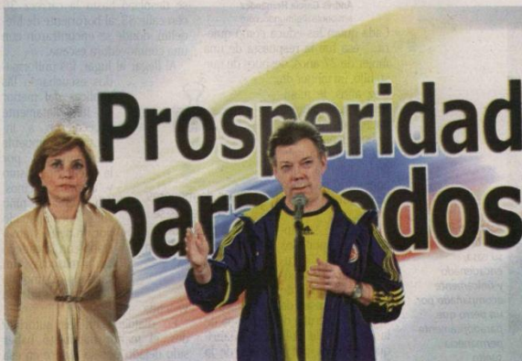
Antes de viajar a Barranquilla para acompañar a la selección Colombia en su partido de Eliminatorias, Juan Manuel Santos dejó instrucciones a la Ministra de retirar la reforma inmediatamente.