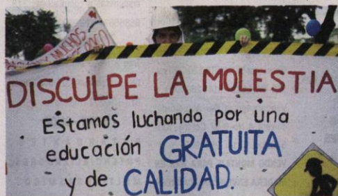
El gobierno asegura que la reforma lo que busca es aumentar su cobertura educativa superior y su calidad.