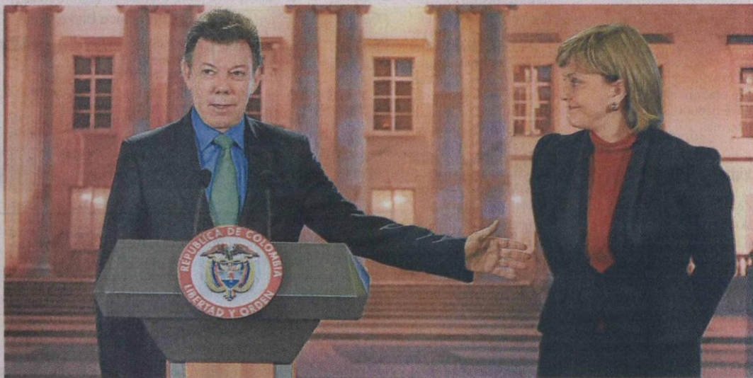
■ Santos explicó que el proceso requiere una votación en la comisión respectiva, para que sea aprobada y oficialmente se retire el proyecto. En la foto: El presidente Santos y la ministra de Educación, María Fernanda Campo.

Agregó que esto es “una demostración más de nuestra bu-