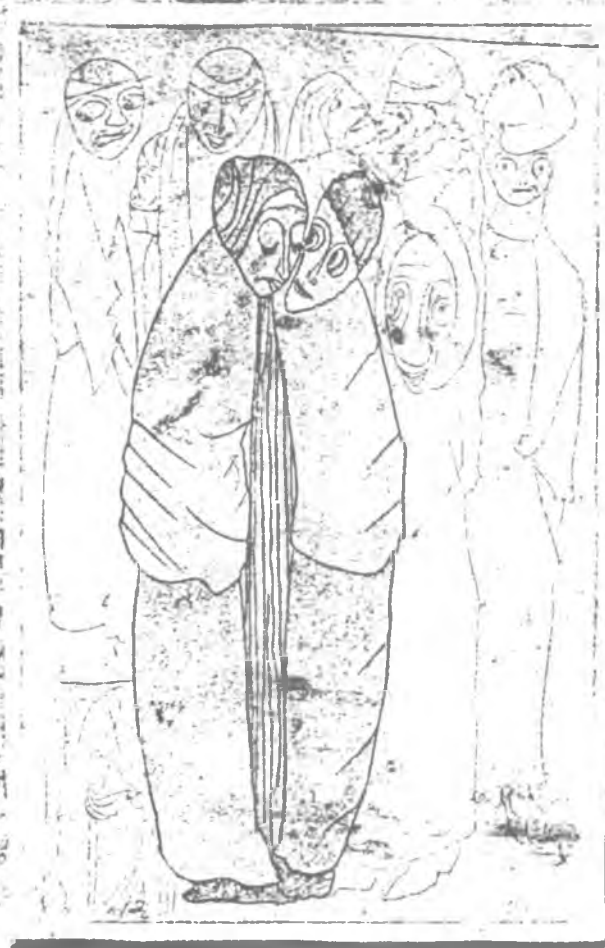
Grabado de la Mesquita, Bruno Ernst

Además, mientras el escolar tenga el mismo conocimiento que su intérprete, no requiere del arte de la interpretación, por la confianza depositada en él, pero a medida que aumenta el caudal de conocimientos