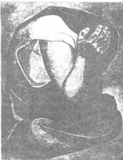
Llanto, Eduardo Kingman

Ya en nuestro siglo, Gadamer señala a Heidegger como renovador de la hermenéutica, el cual enfocará el problema de la comprensión hacia la "existencia", que es la comprensión del ser. Para Heidegger la hermenéutica no significa tanto "arte interpretativo," como el intento de determinar la esencia de la interpretación a partir de la "hermenéutica de la existencia", la cual se interpreta a sí misma en el mundo y en la historia.(8)