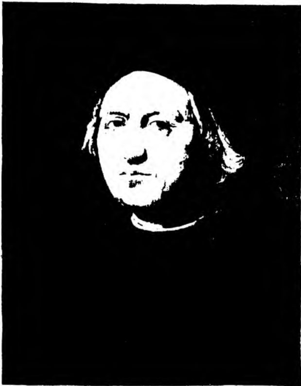
Christoforo Colombo Cristóbal Colón (1451-1506) Museo Civico Nazionale, Pogli. Genova

Además se reforzó con el esquema de Max Weber que planteó la oposición entre dos principios, uno comunitario , basado en los valores tradicionales, y el societario , que es el moderno de la sociedad eficiente capitalista