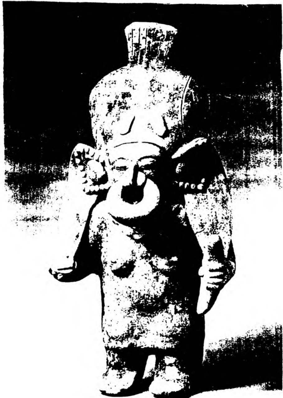
Escultura de barro. Figura hueca, representación de una mujer en pie. Barro de tonalidad crema, alisado. Altura, 31,9 cm. Ecuador: estilo La Tolita

3) BOFF, Leonardo. Y LA IGLESIA SE HIZO PUEBLO , Ed. Paulinas. Bogotá, 1987, p. 42.