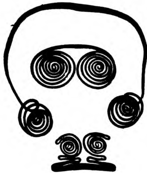
Pectoral en espiral doble

Y esa totalidad integra lo consciente y lo inconsciente, lo determinable y lo indeterminable, lo sagrado y lo profano, las instituciones y los ritos.