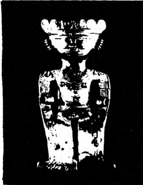
"Colgante "Darién" procedente de la Serranía de San Jacinto.

La cultura no es pues un bien mostrenco, sino que es la cualidad propia que caracteriza al hombre, y se expresa mejor en ritos que en obras, y es por ello primero funcional antes que institucional. Es pues la expresión más radical de nuestro ser.