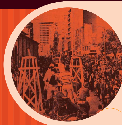
Detalle del carnaval estudiantil de los años 20 en Bogotá.