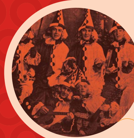
Detalle del carnaval estudiantil de los años 20 en Bogotá.

Se comprenden en el conjunto del Orden Simbólico: Las representaciones de personajes o de referentes puestos en escena, las músicas y los himnos de identidad, las banderas, las marcas y los logos definidos, los lugares y los no lugares, los espacios abiertos y cerrados, el vestuario, el maquillaje, los colores, los olores, los sabores, los ornamentos, el concepto del desfile central y como eje principal de un carnaval, el rol de la risa y de la inversión social.