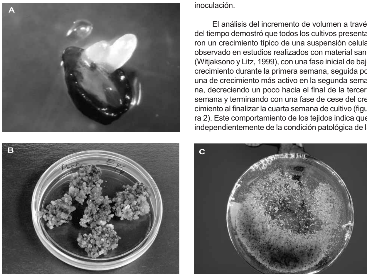
Figura 1. Cultivos embriogénicos de aguacate; A: inducción a partir del nucelo, B: mantenimiento en medio semisólido y C: mantenimiento en medio líquido.

El análisis del incremento de volumen a través del tiempo demostró que todos los cultivos presentaron un crecimiento típico de una suspensión celular observado en estudios realizados con material sano (Witjaksono y Litz, 1999), con una fase inicial de bajo crecimiento durante la primera semana, seguida por una de crecimiento más activo en la segunda semana, decreciendo un poco hacia el final de la tercera semana y terminando con una fase de cese del crecimiento al finalizar la cuarta semana de cultivo (figura 2). Este comportamiento de los tejidos indica que, independientemente de la condición patológica de la