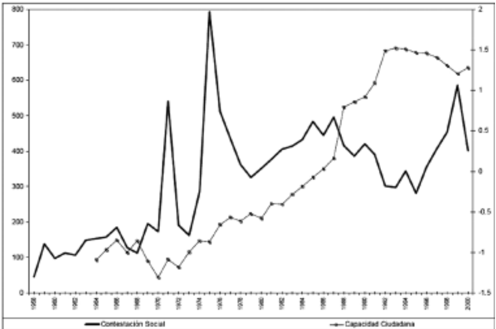
Figura 2. Contestación social y capacidades ciudadanas, Colombia, 1958-2000. (Correlación: r = 0,29^{**} , N = 37 )