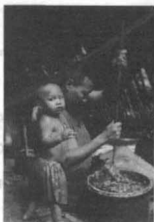
tomada en julio de 1993