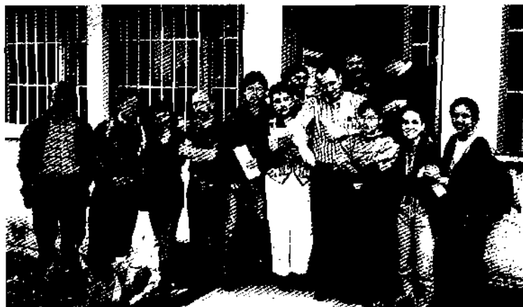
Participantes en el Curso Internacional de Peritación Antropológica, Dic/97.

Laboratorio de Antropología Forense Santa Fe de Bogotá, Ciudad Universitaria, Teléfonos: 316 5047, 316 5000 ext. 16326.