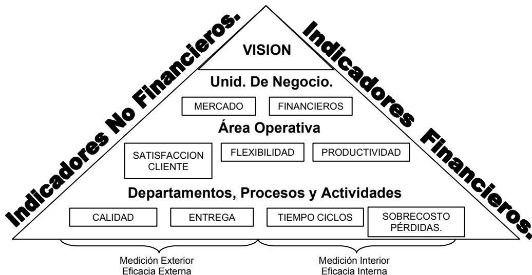
Figura 1. Pirámide de resultados. Presentada por McNair, Richard L Lynch y Kelvin F. Cross (Noviembre de 1.990).

Mc. Nair, Lynch y Cross (1990), proponen el modelo de la pirámide de resultados (Figura 1), en la cual se establece con claridad la visión de la empresa, en donde se hace indispensable el equilibrio de indicadores financieros y no financieros.