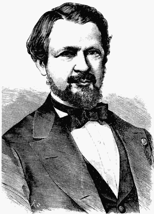
José Jerónimo Triana naturalista colombiano, una de las figuras de la Comisión Corográfica y catedrático de la Escuela de Ciencias Naturales de la Universidad.