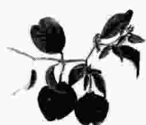
U. LINDL. 1840.