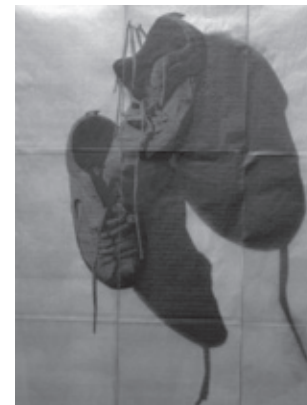
Naturaleza muerta n.º 7

No me voy a dejar derrotar. En mis vigiliass se me aparece otra idea. Con las mujeres que recorremos los montes y las ciénegas, los páramos y las llanuras, los patios de los talleres y los solares, los recuerdos que nos quedan y preservamos, el desocupado espacio de los olvidos, que duele, la voluntad que nos impulsa a resolver la muerte porque sin muerte en paz no hay vida posible, sería una vida perseguida o cubierta por la sombra de las muertes clamorosas, con ellas y conmigo las mujeres vamos a pedir rogar implorar rezar orar al santo Padre de Roma que venga aquí, que aquí venga ya, ya, ahora mismo su Santidad, Pontífice, Vicario supremo, Emperador de