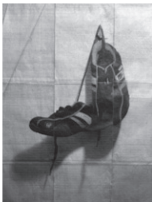
Naturaleza muerta n.º 1