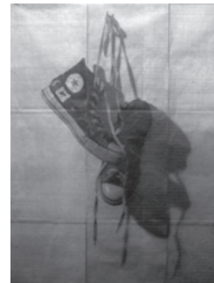
Naturaleza muerta n.º 2

La vida y sus maldades proponen ritos nuevos. Yo estoy obligada a un desentierro para poder enterrar. ¿Se lo imagina? Mi mamá me dijo muchas veces que me dejara de hablar disparates. Que la gente iba a decir que yo estaba loca. Y no. Y no. Cualquier palabra distinta que uno dice en este mundo, que confunde la igualdad con la uniformidad, es rechazada, la matan acusándola de ser nacida de la locura, o que estás borracha, o que eres una marica, también le dicen maricas a las lesbianas. Y pienso que si uno nace de un entierro de la vida en uno. ¿Te imaginas? La gozosa compenetración te preña. Hoy hay control. Puedes celebrar el placer sin el peso de la responsabilidad. En el placer solo eres responsable del gozo. Supongamos: te preñas y te preñan. De ese entierro entrañable, me lo entierras para enterrar, empieza la vida. Y allí crece. Yo no cavo. Desde mi interior la vida aflora, cavar desde adentro. Y surge. Entonces es algo contra el orden de la naturaleza someterse a tres entierros: el de la