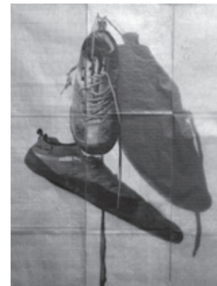
Naturaleza muerta n.º 5

A lo mejor las enseñanzas que recibí en el colegio; el margen de autonomía en la universidad por el que vi correrse la frontera de las subordinaciones controladas y que más asuntos dependían solo de mí en tanto estudiaba la pedagogía. No era que