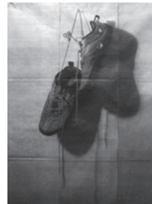
Naturaleza muerta n.º 4

Para enterrarlo tengo que encontrarlo. No me interesa saber el motivo de su muerte. No resolverá el absurdo, ni lo hará resucitar. ¿Qué vale un castigo de encierro o confinamiento ante un acto condenable que es definitivo, sin reparación equiparable? No quiero decir que deben desaparecer al que desaparece a alguien. No. Caminaré senderos, pantanos, siembras abandonadas, trochas, pistas escondidas para aviones de cargamentos de sigilo, baldíos, invasiones, cultivos, franjas de desierto, bosques con niebla, playas salitrosas, ciénegas, carboneras, corrales, salinas, platanales.