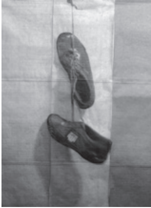
Naturaleza muerta n.º 6

los límites hubieran desaparecido sino que aparecían lejanos para las decisiones de cada día: levantarme de la cama, hacer las tareas, preparar el examen, ir al baile, dar un beso, dejarme acariciar, seguir aquí o no seguir aquí, todo esto perdió su rigidez inexorable. Y a lo mejor también las novelas que leí y los melodramas que vi entre cabeceos de dormidas en la televisión y, no voy a negarlo, los años en la casa de los padres con su método tierno de repetir, repetir, repetir, indefensos. Así, a lo mejor, el colegio, la universidad, la casa, las novelas, me fueron preparando para despejar las incertidumbres de la existencia, el temor que paraliza con su temblor acoquinado porque es inevitable pasear esos senderos en los cuales pones a prueba una ilusión muchas veces endeble. A lo mejor.