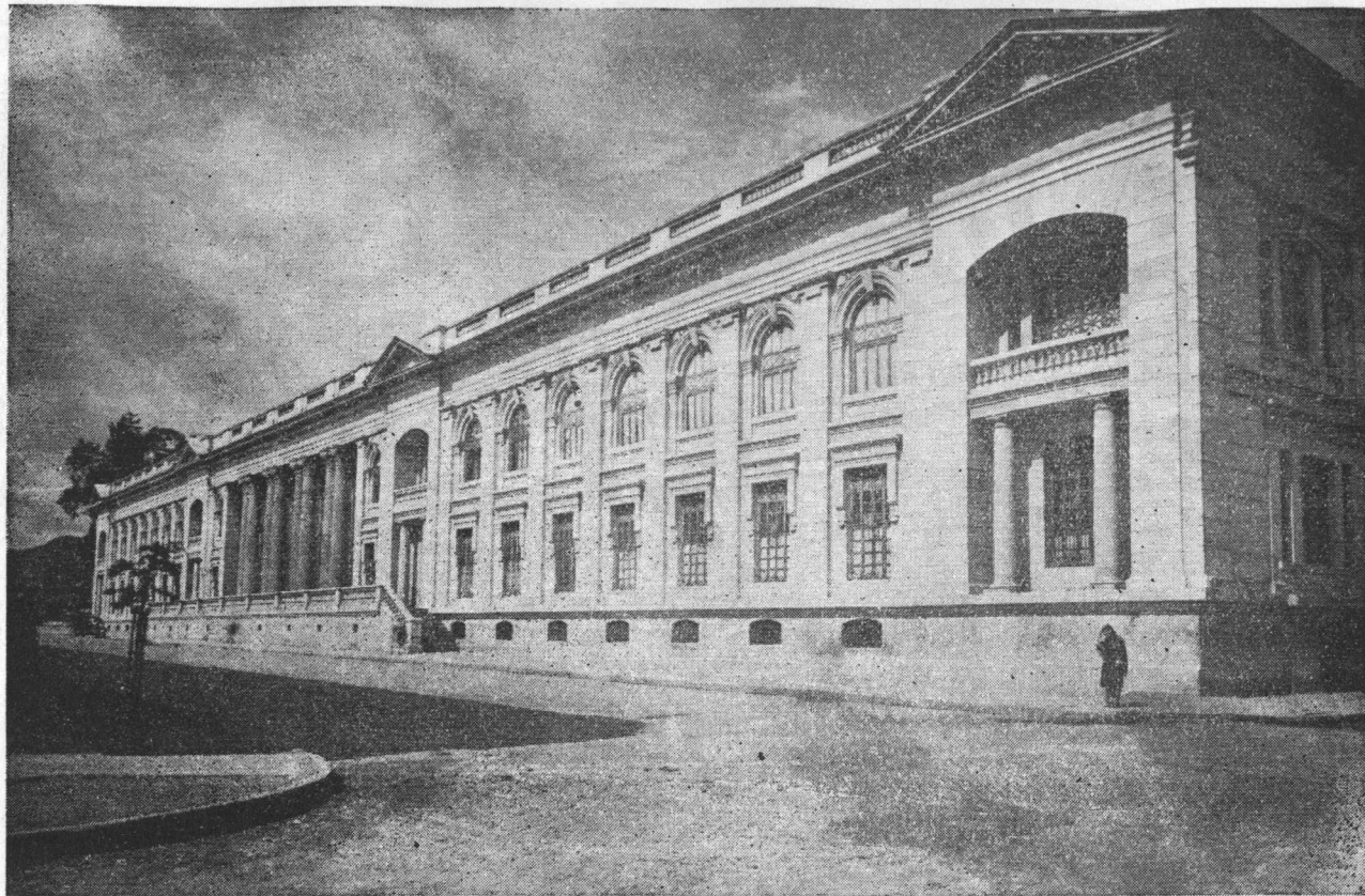
RECTORIA, FACHADA OCCIDENTAL, CARRERA 15.