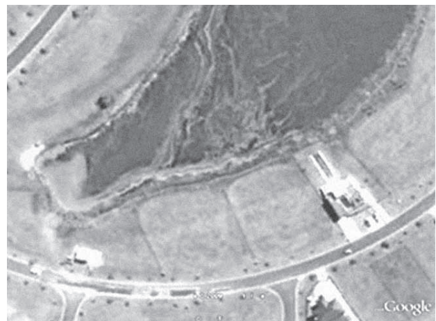
Figura 6. Floraciones algales en lago de San Isidro Labrador (Villa Nueva).

La búsqueda de lagos con formas cada vez más complejas tiene como contrapartida mayores costos en cuanto a su manutención. Ello ocurre en especial con el caso de los espejos de agua confinados en los que se crean condiciones de estancamiento contraproducentes para lograr la oxigenación de las aguas, a lo que se denomina como “aguas muertas” (figura 6). En contraposición, en los lagos de formas más sencillas, con “geografías costeras” menos sinuosas, el efecto del viento favorece el oleaje y con ello la oxigenación de las aguas. Cabe señalar que los lagos confinados tienden naturalmente al aumento gradual de nutrientes que producen un crecimiento excesivo de algas, las que al sucumbir se depositan en el fondo y generan residuos orgánicos que consumen gran parte del oxígeno disuelto, lo que afecta la vida acuática y hasta la muerte de la fauna y la flora. Algunas de las algas que se generan en estos procesos pueden emitir sustancias tóxicas, como, especialmente, ciertas cianófitas, que matan a la fauna del lago e inclusive puede ser peligrosa para la salud humana. Estas algas tienen un color verde azulado, aparecen en el agua como manchas de pintura y emiten un olor a insecticida (Chiodo Llauro y Rodríguez Larreta 2001) 15 . La reproducción de esas algas también se ve favorecida por el aporte de nutrientes derivado de la utilización de agroquímicos para mantener a los céspedes verdes todo el año —especialmente en el caso de las canchas de golf—.