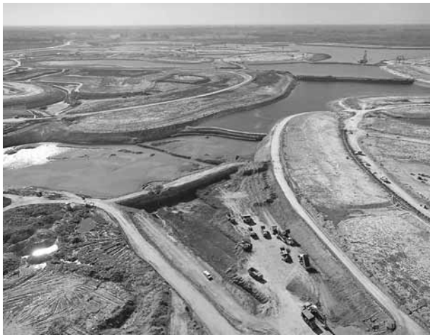
Figura 5. Construcción del lago central de Nordelta.

Los cuerpos de agua de las UC de Tigre presentan formas, dimensiones y profundidades diversas. En cuanto a los lagos, los hay desde pocas hectáreas y escasas profundidades, hasta aquellos que alcanzan gran cantidad de hectáreas y profundidades importantes. Entre estos últimos, el ejemplo más representativo corresponde al gran lago central de la mega UC Nordelta, cuya superficie alcanza más de 180 hectáreas y sus profundidades se encuentran entre los 20 y 30 m (figura 5). Con el paso del tiempo, las formas de los cuerpos de agua de las UC de Tigre han ido cambiando. A comienzos de la década de los noventa, los lagos confinados, marinas y canales de las UC presentaban formas simples; poco tiempo después, aparecieron formas tales como bahías, penínsulas e islas. Ya en los últimos años, los cuerpos de agua empezaron a adoptar formas similares a las del “coral cerebro”, lo que complejizó su geografía de “accidentes costeros” 12 . Al ampliarse las líneas de costa se acrecentó la cantidad de lotes frente a los nuevos cuerpos de agua, con lo que se logró obtener rentabilidades mayores.