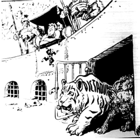
Figura 2. «...en el circo máximo de Buenos Aires...».

Fuente: Aldor, «Persecuciones», El Tiempo, Bogotá, 17 de junio de 1955, 4.