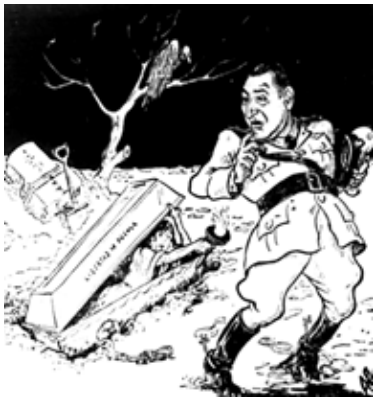
Figura 4. - ... ¿si pudiera resucitar?...

Para finalizar el examen de la serie de tres caricaturas, ahora centraremos nuestra atención sobre la viñeta publicada el día 27 de junio, titulada «Esperanzas».