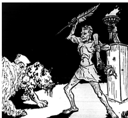
Figura 1. «... contra todos los totalitarismos...». Fuente: Aldor, «En el día de la libertad de prensa», El Tiempo , Bogotá, 7 de junio de 1955, 4

Como detalle adicional, junto a tales editoriales, ha de apreciarse una caricatura en donde se representa a un sujeto que porta una pluma, la cual emplea como arma para atacar a dos bestias (un lobo con esvásticas, referente al nacionalsocialismo alemán, junto con un oso, representación gráfica común del régimen comunista ruso) que encarnan la síntesis de todos los regímenes contrarios a la libre circulación de ideas. La ilustración se acompaña de una nota al pie con la consigna «... contra todos los totalitarismos» 10 .