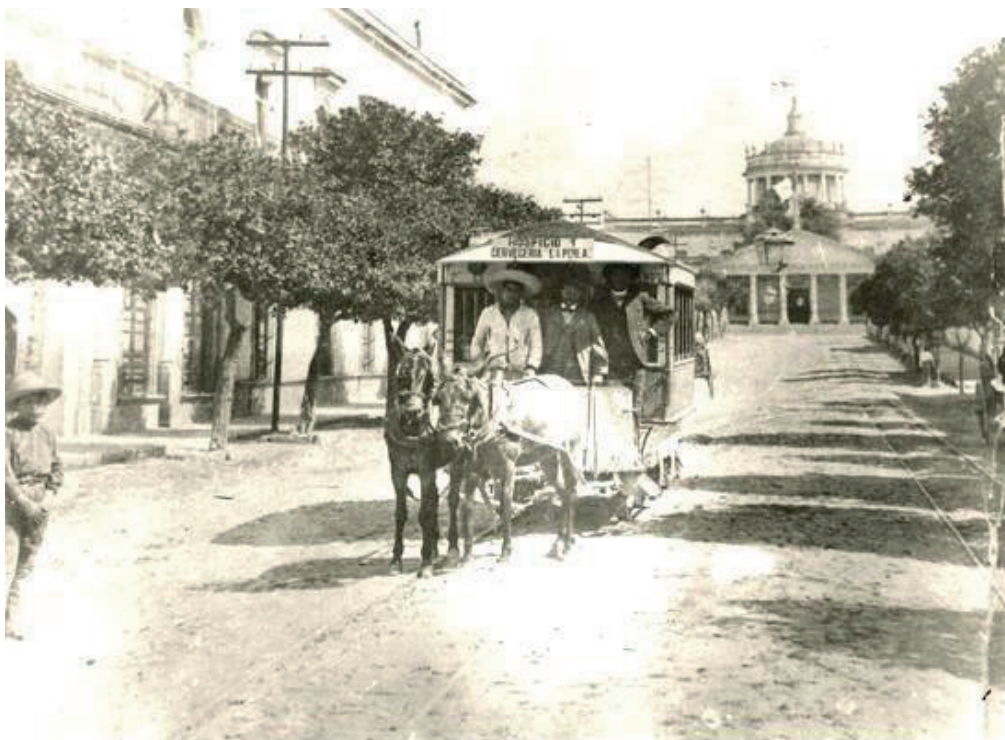
Figura 1. Tranvía de mulas