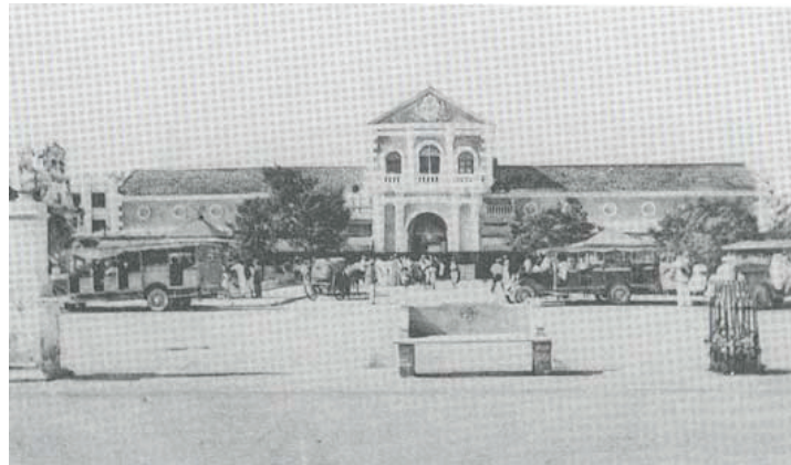
Figura 1. Mercado Público, 1904-1977. Vista principal.