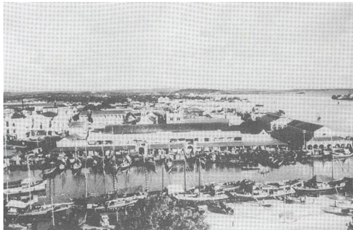
Figura 2. Mercado Público, vista desde la bahía de Las Ánimas.