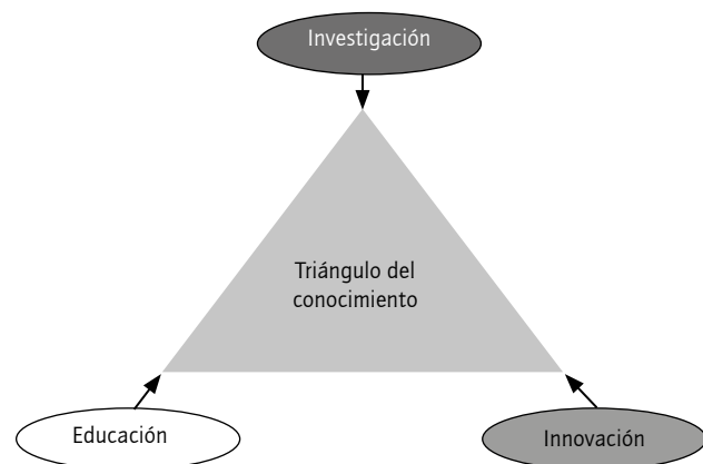
FIGURA 1. La triple misión de la Universidad