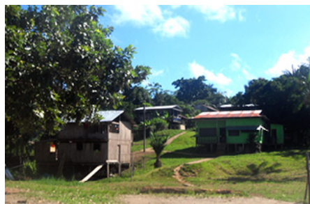
Fotografía 3 Puerto Esperanza en el 2016.

Puerto Esperanza está actualmente habitado por 595 personas, 110 familias en 95 casas 9 . La conexión con otros lugares se realiza a través del río, un camino peatonal pavimentado que conecta con Puerto Nariño y trochas selva adentro. La comunidad no dispone de bote propio, lo cual les dificulta el desplazamiento hacia zonas más alejadas como Leticia, así como las actividades de trueque o comercialización de productos con los vecinos.