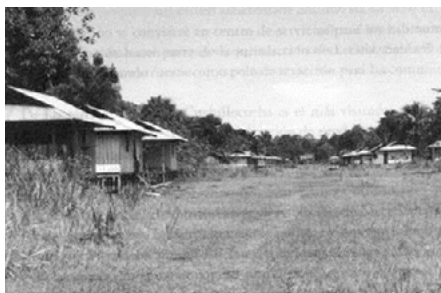
Fotografía 2 Pozo Redondo año 2000.

Con el crecimiento demográfico se construyeron otras viviendas, equipamientos públicos como la escuela, el centro de salud, la cancha deportiva, la sede comunal y una maloca, algunos de ellos con recursos del sistema general de participaciones para comunidades indígenas. La construcción palafítica, propia de las zonas de inundación como Pozo Redondo se readaptó en Puerto Esperanza como estrategia para nivelar la pendiente del terreno (fotografías 2 y 3).