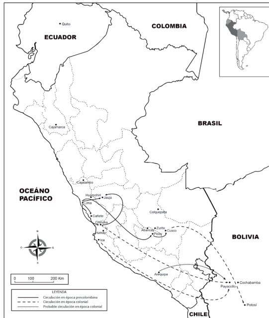
Mapa 1. Desplazamiento de los plateros indios Sacayco por Suramérica, tanto en la época precolombina como en la colonial