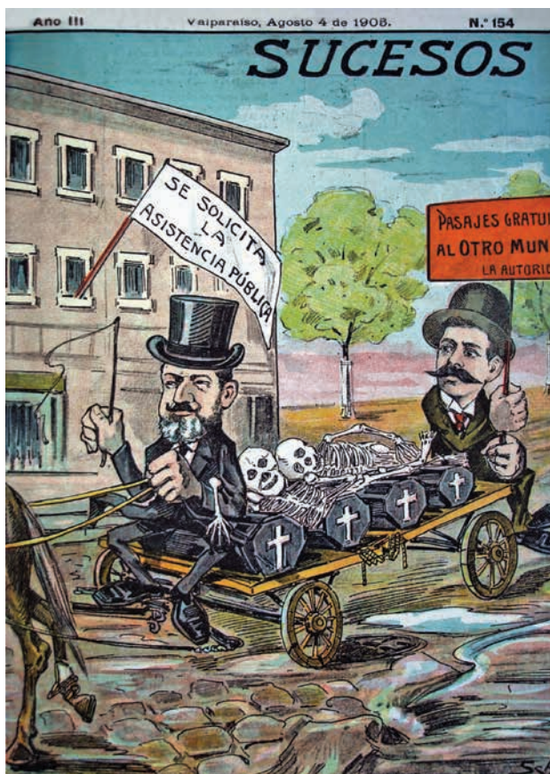
Figura 1. “Peor es nada”.

epidemias. 4 Ciertamente, la relevancia de este problema no dejó indiferente a las autoridades locales (figura 1).