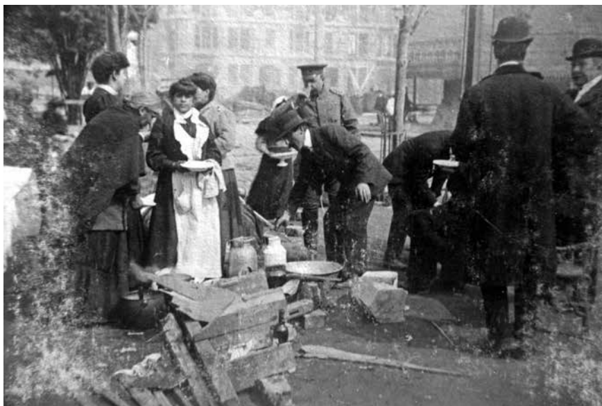
Figura 4. Campamento en Plaza de la Victoria el 17 de agosto de 1906.