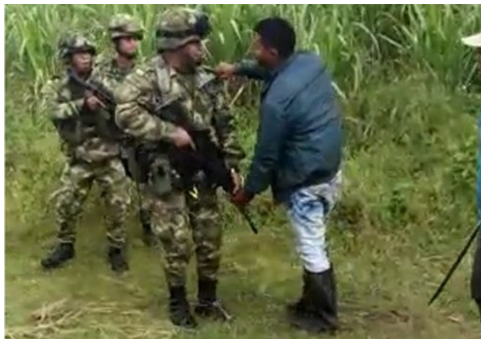
Ilustración 9. Liberación de la madre tierra. Imagen tomada del video Indígenas protegen La Madre Tierra, ver en https://www.youtube.com/watch?v=IO14UumtKEA

Los jóvenes que no alcanzan a beneficiarse de los proyectos y programas para indígenas, tienen pocas opciones y una de ellas es continuar el camino de lucha de sus ancestros. Algunos de ellos se van a Liberar la Madre Tierra, a cultivar comida en medio de las balas disparadas por el Ejército nacional desde los puestos de vigilancia privada de los terratenientes del Valle del Cauca 25 .