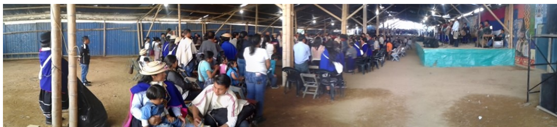
Ilustración 2 Panorámica de "el silo" edificación en la entrada del Resguardo La María. 2013

El territorio total es la gran casa, Nupirau , y tiene el fogón mayor (ver ilustración 3 con el listado de cabildos y asentamientos para 2013) La María (Ilustración 2) corresponde a uno de los fogones que componen el Nunakchak . (Tunubalá, 2008)