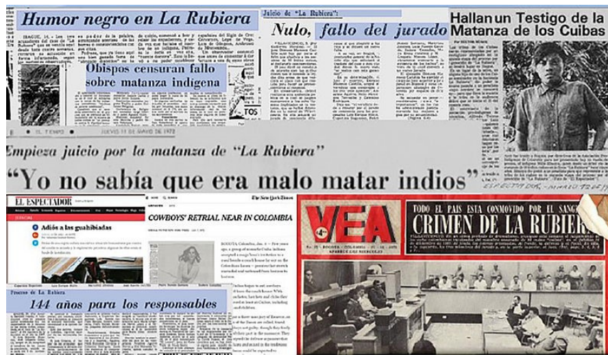
Ilustración 1. Titulares por la masacre de la Rubiera, Arauca, 26 de diciembre de 1967. Tomada de González, 2018

“Los indígenas son seres humanos, pero en la memoria de los llaneros persiste la idea de que son dañinos o que son una plaga, pero en verdad fueron víctimas de la violencia. Sé que este pensamiento puede superarse y de esta forma mejorar sus condiciones de vida”