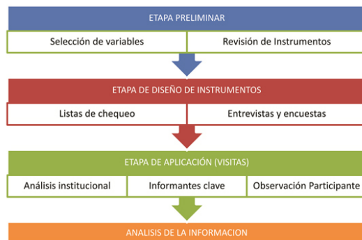
Figura 1. Ruta metodológica seguida en la investigación.

La investigación se realizó con base en métodos cualitativos, con los cuales se buscó extraer información primaria directamente de las IES, principalmente a través de entrevistas personalizadas, encuestas semiestructuradas y listas de chequeo (Figura 1). Para la construcción de los instrumentos se realizó inicialmente una lista de las variables a medir u observar en cada uno de ellos, haciendo una definición conceptual y operacional de dichas variables, además de una revisión de los instrumentos ya existentes (Toro, 2004; Fernández-Manzana et al. , 2007; Ballantyne & Packer, 2009), que fueron usados con algunas adaptaciones a los objetivos de la investigación.