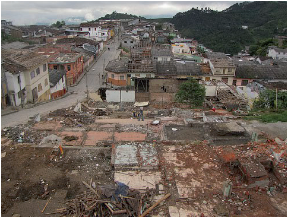
Figura 2. Predios demolidos en San José.

De acuerdo con la opinión de diferentes expertos que en la ciudad de Manizales se han unido para debatir sobre el asunto, este proyecto que simula ser de carácter netamente social y comunitario, carece totalmente de equidad, convirtiéndose en la suma de intereses individuales. Allí la alianza público-privada, afirma Acebedo (Concejo de Manizales, 2013), debatiente del proyecto, plantea la urgencia de replantear el proyecto, “ En la medida que se han desfigurado la aplicación de los instrumentos que prevé la Ley para garantizar la equidad, la justicia social, las soluciones integrales ”.