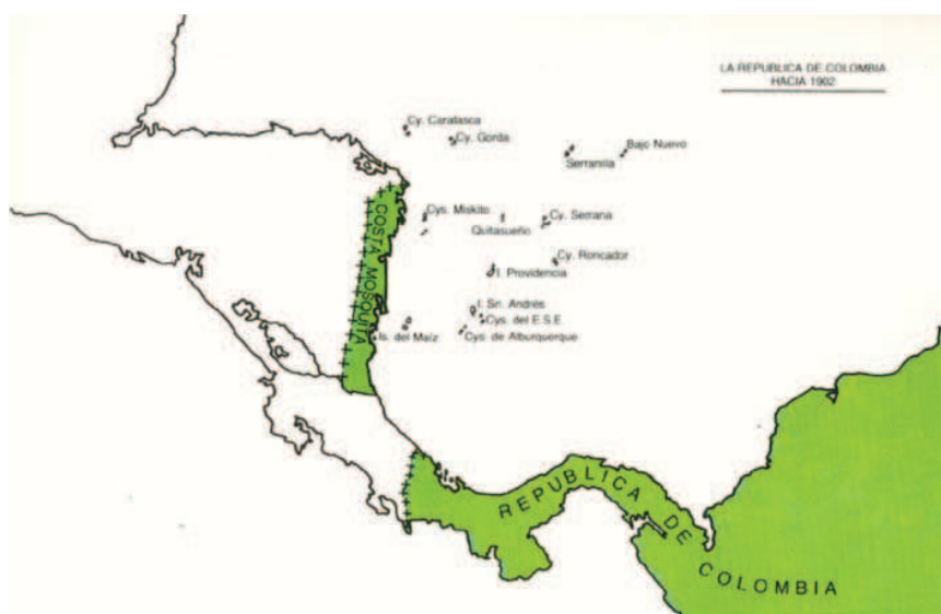
Fig.2 Mapa de la República de Colombia hacia 1902 (Tomado de Uribe, 1980).

Cualquier colombiano al observar el mapa de la República hacia 1902 (fig. 2), seguramente se cuestiona ¿Cómo fue posible que nuestros gobernantes de otrora permitieron la pérdida de tan extensos territorios? Lastimosamente, desde la misma creación del Virreinato de la Nueva Granada en 1717, se acrecentaron los problemas de administración de un territorio demasiado extenso, pobre e incommunicado. Los procesos de independencia de España no solucionaron la problemática, ya que los nuevos gobernantes, al igual que la burocracia colonial que le antecedió, no se dedicó a las transformaciones sociales, económicas, políticas y culturales, y simplemente concentró sus esfuerzos a la celebración de alianzas continentales, para defenderse del imperio español. Estas alianzas se hicieron de espaldas a la sociedad y su cultura, no atendieron su problemática, y mucho menos las fragmentaciones regionales y económicas, provenientes de trescientos años de dominio español, y que en definitiva ponían en riesgo la unidad nacional, y nos hacía muy vulnerables a presiones de potencias extranjeras. 135 De hecho, poco tiempo trascurrió para que bajo la influencia de los Estados Unidos, se formalizara en 1903 la independencia de Panamá, proceso durante el cual presuntamente hubo acercamientos sin éxito para que los habitantes de las islas de San Andrés y Providencia se unieran a esta iniciativa.