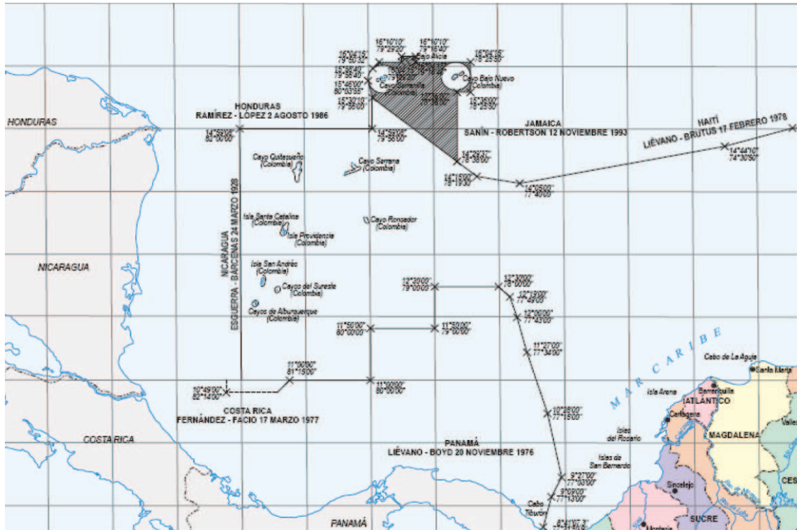
Fig. 1. Localización geográfica del archipiélago de San Andrés, Providencia y Santa Catalina.

La economía de las islas está basada en el turismo y el comercio, seguidos por actividades primarias, como la pesca, que es el principal conector de la economía con la comunidad raizal. El archipiélago soporta importantes pesquerías, tanto a escala artesanal como industrial, dirigidas principalmente a la explotación de la langosta espinosa, el caracol pala, y gran variedad de peces demersales y pelágicos, que juegan un importante rol en la seguridad alimentaria de la población y en la generación de divisas.