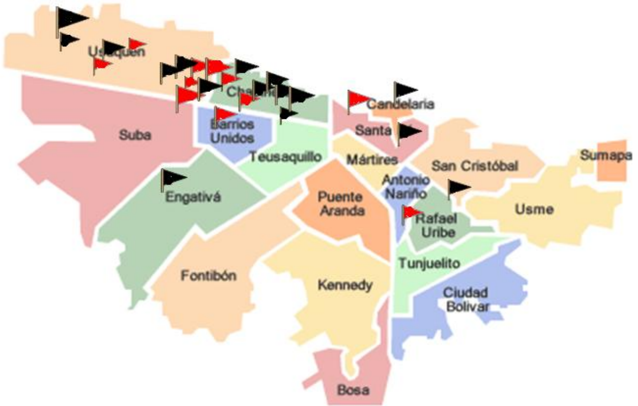
Gráfico 4. Ubicación de farmacias homeopáticas en Bogotá

Fuente: Mapa: consulta en línea www.bogotamiciudad.com . Las Banderas representan la localización de las farmacias y sus sedes. Banderas: Elaboración propia