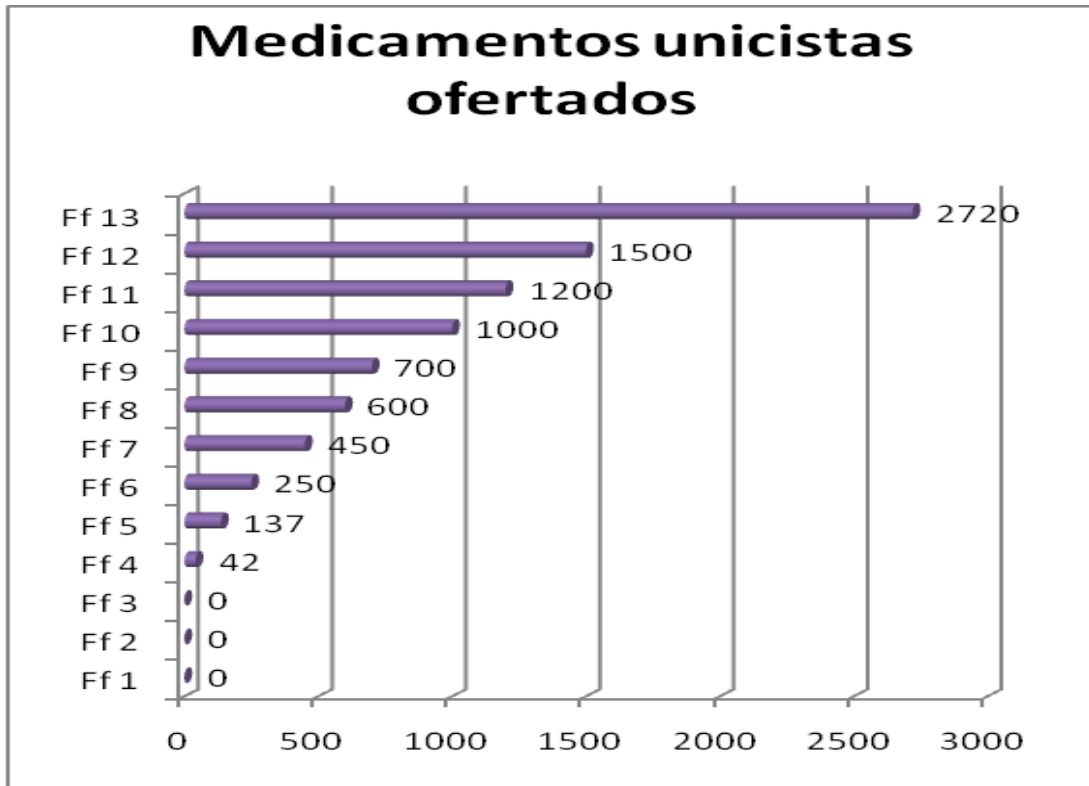
Gráfico 6. Medicamentos unicistas ofertados

medicamentos ofertados por desconocimiento de la información y esta evidenciado en la grafica con cero.