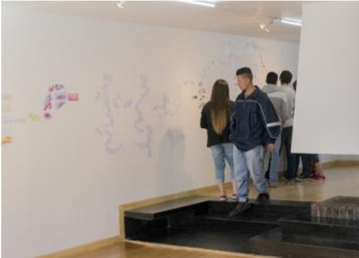
Imagen 5. Estudiantes observan exposición artística

reconozca este también como una práctica artística y cultural que se asemeja a lo que ha logrado identificar del proceso creativo de los artistas por medio del diálogo.