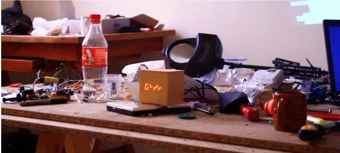
Imagen 4. Instrumentos y recursos del 'arte contemporáneo'

Nota: El artista David Peña utiliza materiales tecnológicos y otros para sus instalaciones artísticas de lo que considera el arte contemporáneo.