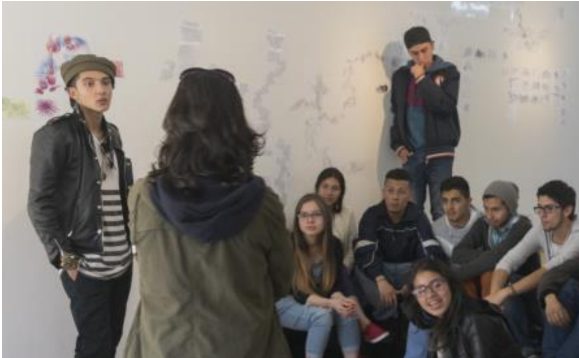
Imagen 1. Talleres como ecosistemas comunicativos

estudiantes se encuentran acostumbrados; se reemplaza el aula por un taller que genera un ambiente mucho más adecuado a los intereses de los estudiantes pues los acerca directamente al lugar donde se da el proceso creativo.