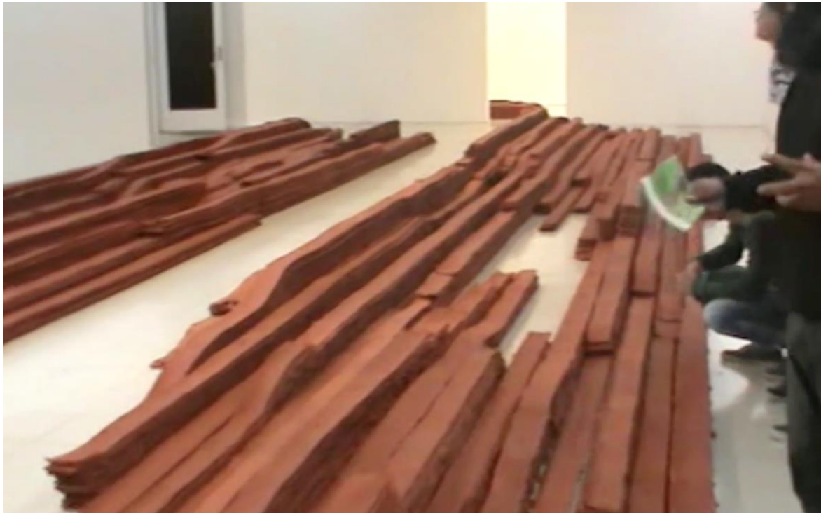
Imagen 2. Producto artístico expuesto a estudiantes

sólo cobra sentido cuando se entiende que hay un componente cultural macro (si se quiere contracultural en este caso) que engloba una nueva perspectiva al tratar de instituir lo que sería una eventual apuesta en las futuras representaciones artísticas o diseños de los estudiantes.