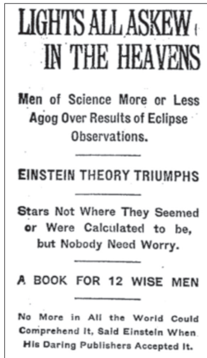
Figura 2. The New York Times de noviembre 10 de 1919.

Solo para dar algunos ejemplos, reproduzcamos algunos de los titulares de The Times , de Londres, y de The New York Times :